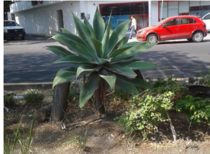
Figura 4. Agave Attenuata en un camellón de la ciudad de Puebla, México.

figura del jardín botánico de Maui, Hawái (Figura 5).