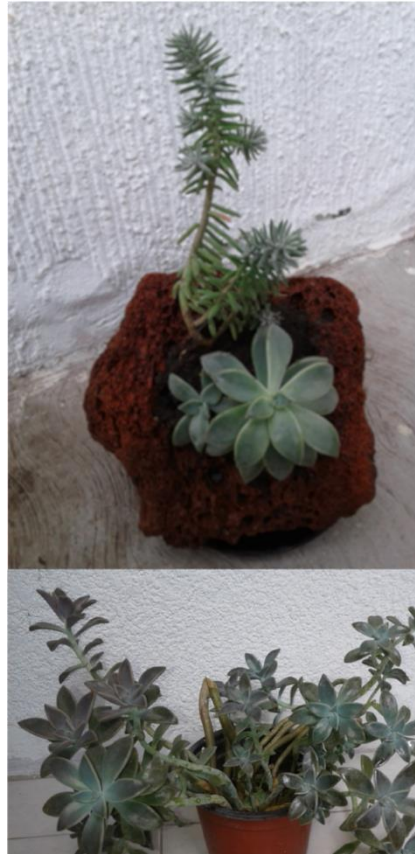
Figura 2. Nombre científico aceptado: Graptopetalum paraguayense . Nombre común: Planta madre perla.

Las hojas viejas que se encuentran en la base de la roseta se marchitan y se caen. El nuevo crecimiento proviene del centro de la roseta, por lo que, con el tiempo, se obtiene una rama larga con una roseta en el extremo. En el ciclo primavera-verano, llegan a tener algunas flores en forma de estrella de color blanco con manchas rojas.