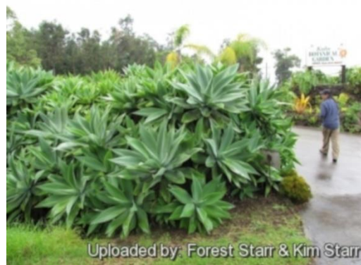
Figura 5. Jardín botánico de Maui, Hawái, E.U.A.

En conclusión, las plantas suculentas son una opción importante de cultivo, cuidado y estética natural, ya que se adaptan bien al clima de los espacios