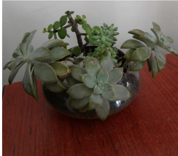
Figura 3. Arreglo de plantas suculentas. Foto tomada en noviembre de 2018 por Gabriela Carvajal Arenaza

Al combinar la planta madre perla con otras, como la planta de la abundancia y la cola de borrego, se pueden formar bonitos arreglos interiores para embellecer el ambiente donde se trabaja, estudia o descansa. La Figura 3 muestra una base o maceta de cristal sin orificio de drenaje en el fondo para las plantas madre perla, las cuales tienen una fina capa gris en sus hojas, misma que le sirve de protección. Se debe evitar frotar esta delicada película, ya que no se regenera, razón por la que no es bueno tocarlas.