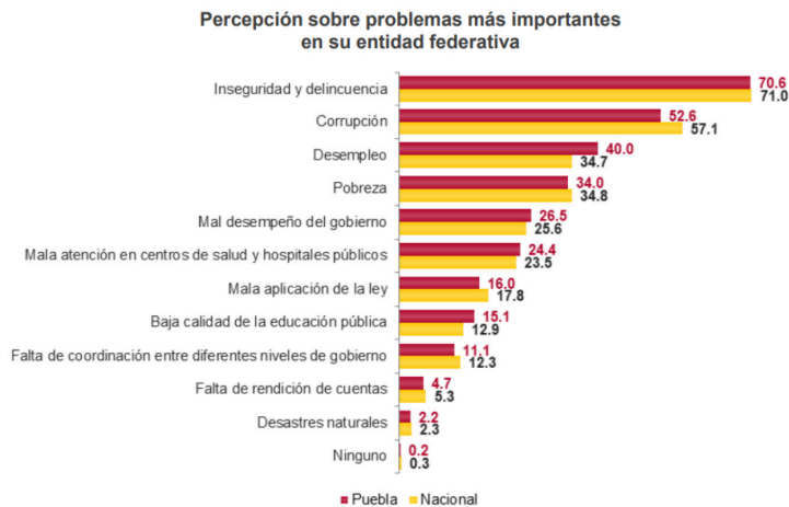
Gráfica 1. Percepción sobre problemas más importantes en su entidad federativa.