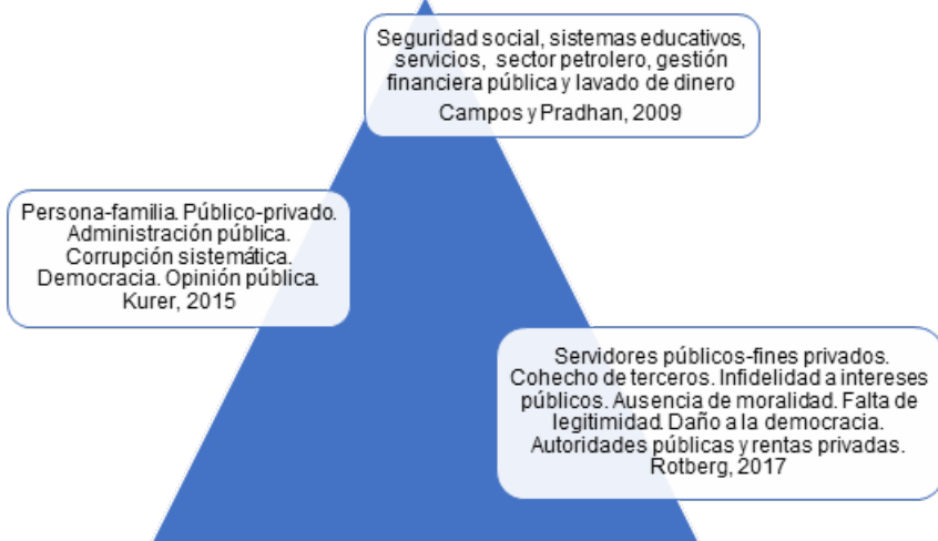
Figura 2 Estudios interdisciplinarios sobre la corrupción

Fuente: elaboración propia conforme autores citados en esta investigación.