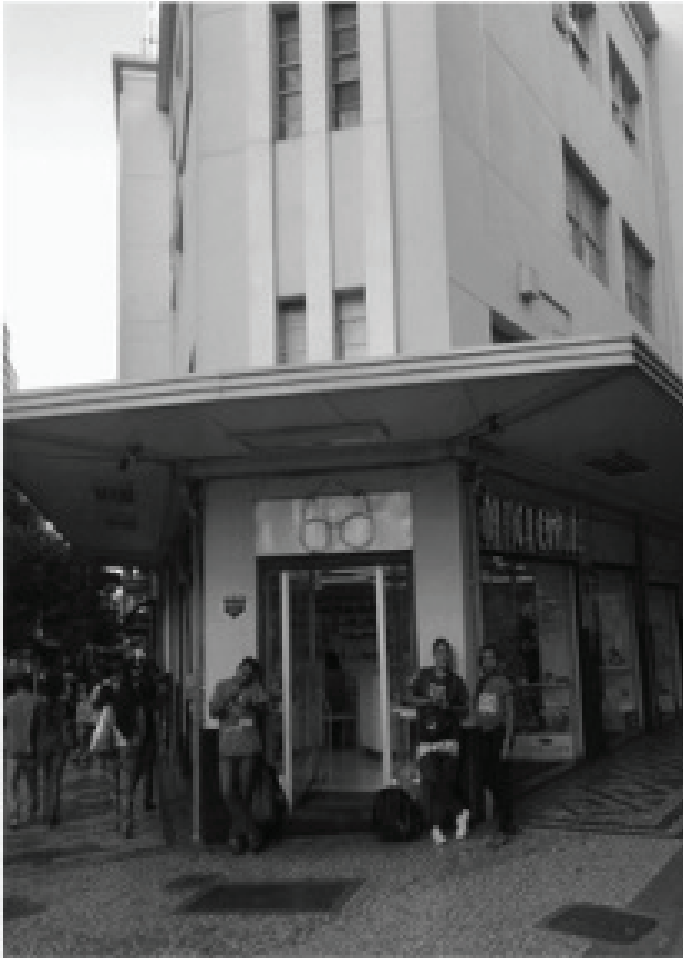
Imagen 2. Vendedores de chips . (Rafael Alarcón Medina)

Si bien el espacio es en términos generales una forma social –un conjunto de relaciones sociales–, la diferenciación entre Forma-Urbana y Forma-Ciudad nos permite cualificar el antagonismo de su existencia abstracta, desvelando las particularidades concretas en que la dominación es mediada espacialmente. El conflicto entre estas formas permite que las contradicciones espaciales del