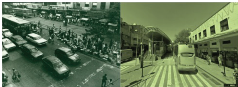
Imagen 1. Izquierda: Av. Paraná 1996. Derecha: Av. Paraná 2016.